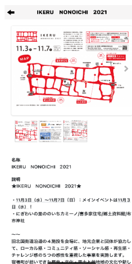
【コンテンツ詳細画面】