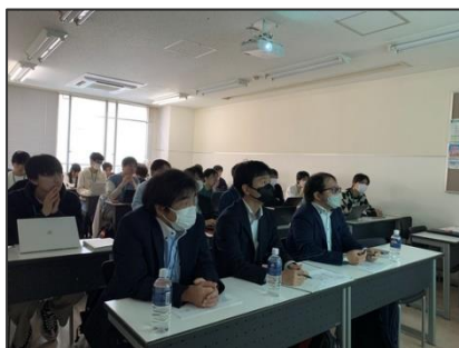
キックオフ会場の様子

今後も当社は産学連携プロジェクトを継続的に実施し、学生たちに実践的なモノ作りの場を提供することで、社会に貢献できる技術者の育成支援を行って参ります。