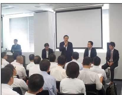
トークセッションの様子