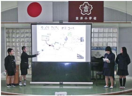
観光マップ発表会で1位の発表の様子