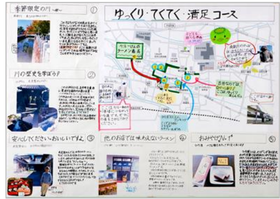
観光マップ発表会1位の作品