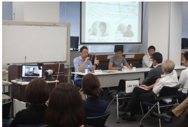
【第二部】パネルディスカッションの様子